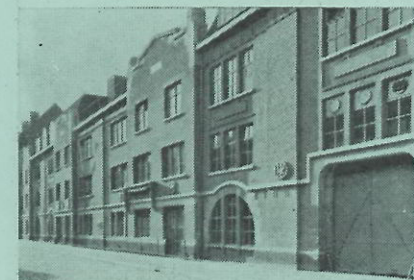
Wat wij destijds een reuzenfabriek vonden — de Stortenbekerstraat