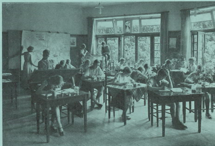
Een klaslokaal van de Pallas Atheneschool te Amersfoort waar men opmerkelijke resultaten behaalde met het nieuwe systeem

De cultuurvorming gaat uit van die kleine groep van begaafden, eventueel nog vermeerderd met de besten uit de groep der vluggen. In het nieuwe onderwijs-systeem, of liever opvoedingssysteem legt men het erop aan, dat de kinderen reeds op school beginnen met hun menselijke deugden tot ontwikkeling en in toepassing te brengen. Met andere woorden, zij mogen elkaar helpen. Dit laatste is een reactie op het bekende: Foei Jantje, je mag Pietje niet voorzeggen.